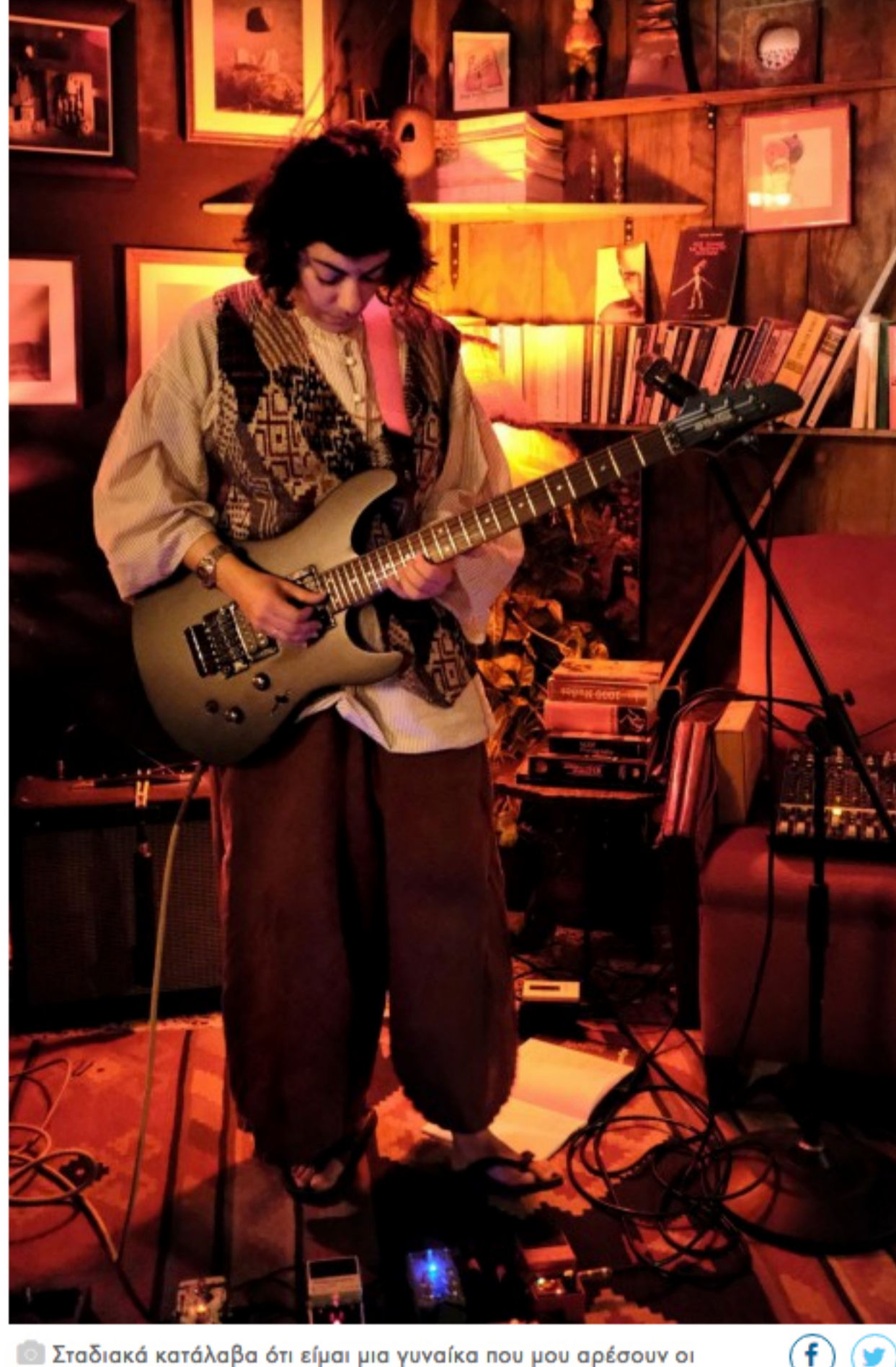
Σταδιακά κατάλαβα ότι είμαι μια γυναίκα που μου αρέσουν οι γυναίκες. Όμως αυτό δεν στο μαθαίνει η κοινωνία αλλά το περνάς μόνη σου, είναι μια προσωπική διαδικασία.

«Νωρίς το πρωί: Μητέρα μου εξέφρασαν μου ευλόγησε την μέρα μου Απόγευμα: Μέσα στου νου τα κόλπα ο σκύλος θέλει βόλτα Αργά το βράδυ: Μετέφερα την λύπη μου χαράματα στο σπίτι μου»